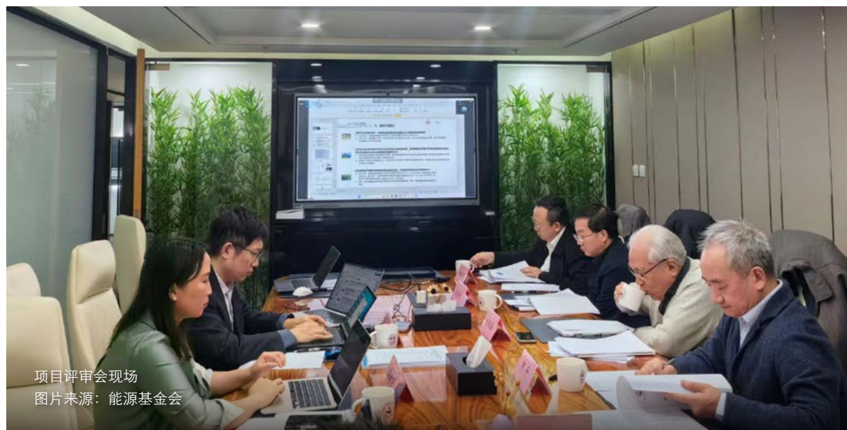
项目评审会现场