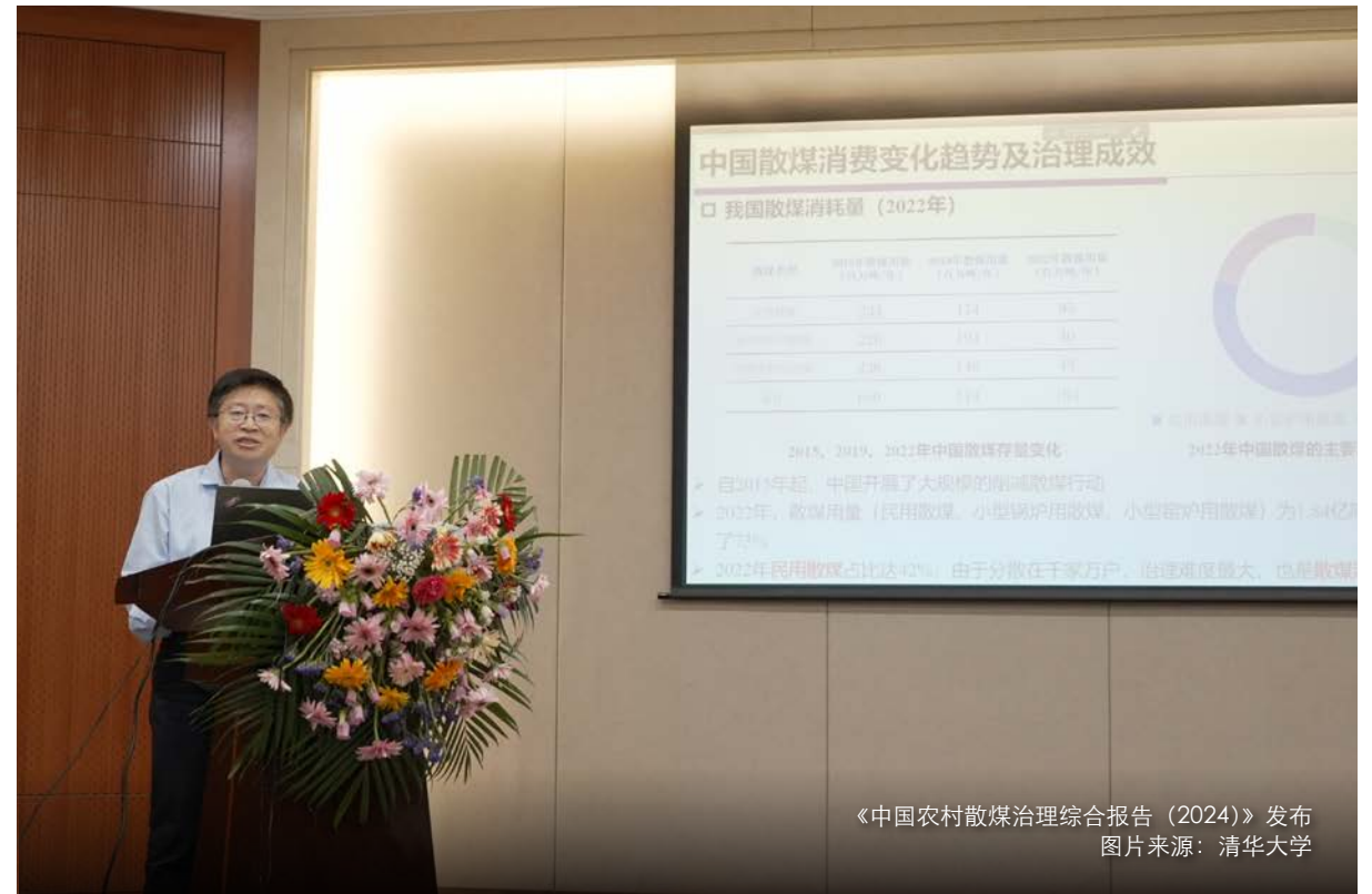
《中国农村散煤治理综合报告（2024）》发布