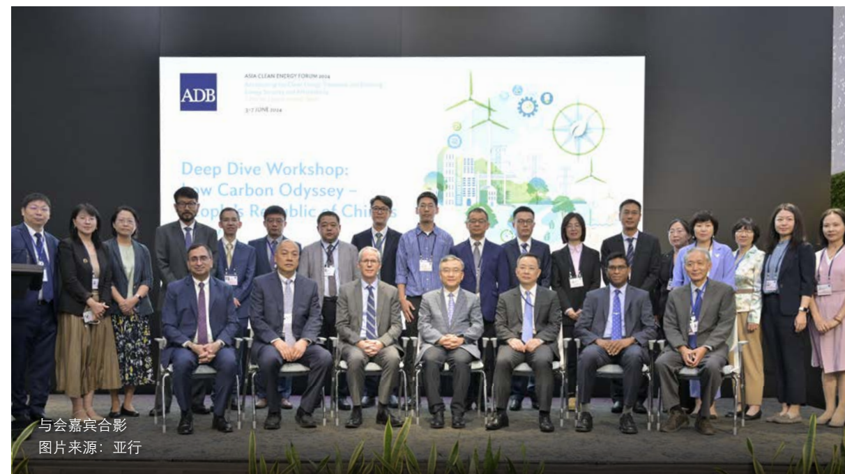
与会嘉宾合影

21世纪20年代是应对气候变化的关键十年。作为最大的发展中国家和最大的发达国家，全球气候治理离不开中美合作。中美在能源转型、低碳可持续省/州和城市等多领域的合作前景广阔。能源基金会始终致力于搭建中美气候沟通与合作的桥梁，推动中美以及全球气候行动的加速落实。