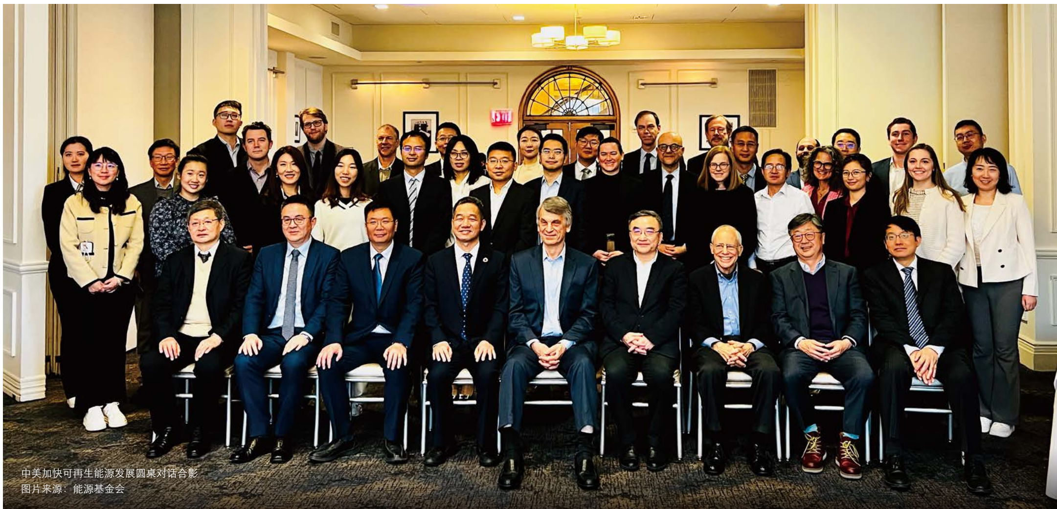
中美加快可再生能源发展圆桌对话合影