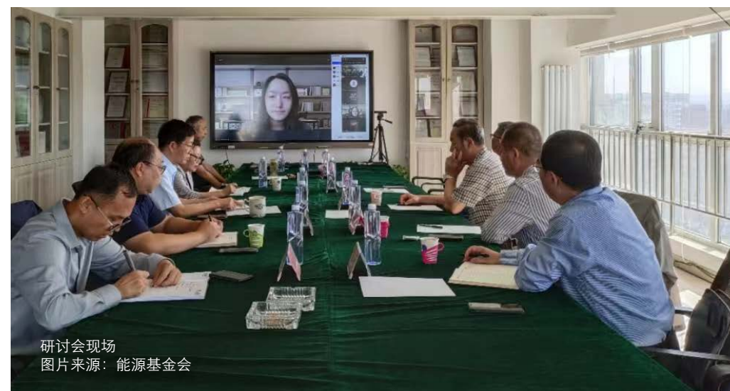
研讨会现场

下一阶段项目组将继续深入研究，一方面延伸能源保供与产业绿色低碳转型共赢理论的技术层面研究，另一方面启动相关领域的实地调查研究。