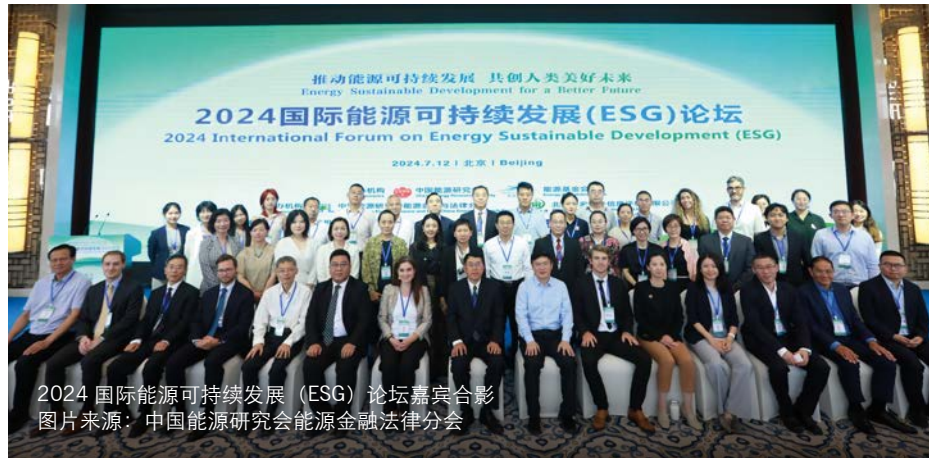
2024 国际能源可持续发展 (ESG) 论坛嘉宾合影