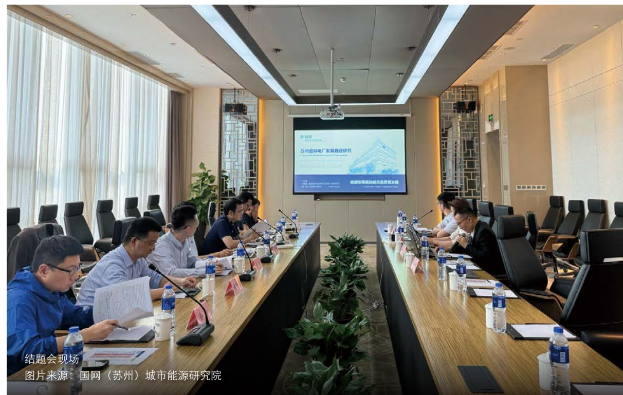
结题会现场