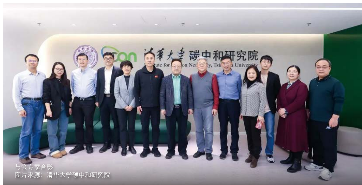
与会专家合影

《中国碳中和目标下的风光技术展望》是能源基金会“中长期低碳发展战略”综合工作组（LTS）三期项目资助下产出的首份报告，凝结了来自清华大学、中国能源研究会可再生能源专业委员会、中国可再生能源学会风能专业委员会、中国光伏行业协会等多家研究机构近百位专家的智慧成果。LTS三期项目立足中国基本国情，针对电力、工业、交通及建筑等重点行业领域和风光技术、储能技术、氢能技术、碳捕获利用封存技术等重点领域，组织国内权威专家编制重点领域碳中和和技术路线图系列报告，为中国实现碳中和战略提供技术支撑。