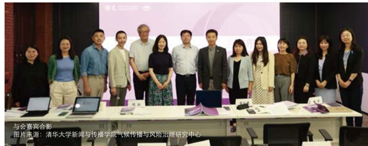
与会嘉宾合影

此外，活动分别针对研究机构和智库，以及公益组织和媒体两类利益相关方设置了报告圆桌讨论，近10位专家各抒己见，为领域提供了多元的视角和建议。