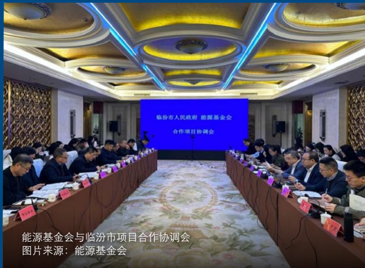
能源基金会与临汾市项目合作协调会